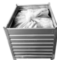
1m³ Metallbehälter (A-Behälter)

Nach der Befüllung den Styroporsack zubinden und ADR-Fassanhänger am Styroporsack befestigen.