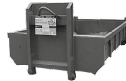
12 m 3 Abrollcontainer