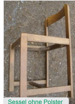
Sessel ohne Polster