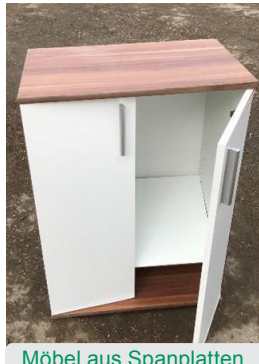
Möbel aus Spanplatten