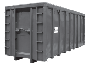
30-40 m 3 Abrollcontainer