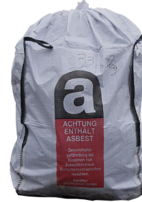
Big-Bag für Asbestzement bei größeren Mengen