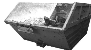
10 m 3 Mulde