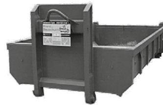
12 m 3 Abrollcontainer